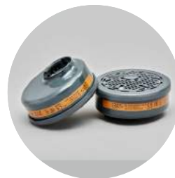
Filtros serie BLS 200