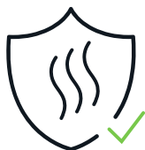
Protección ante gases