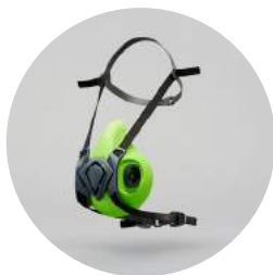
Media máscara BLS 4000 Next S