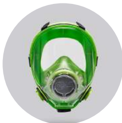
Máscaras BLS 5700