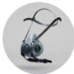
Media máscara BLS 4000 Next R