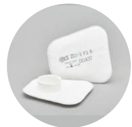
Filtros planos serie BLS 201