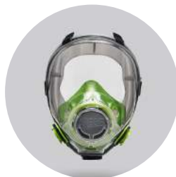
Máscaras BLS 5600